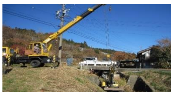
自治会の要望箇所を順次改修 岩間小胡桃沢、北沢川整備