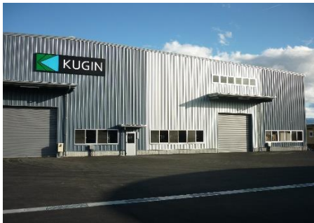
建設資材製造「クギン」様 赤坂へ

春日平に飯島流ワーケーションの宿泊施設、「ii ネイチャー春日平」がオープン。リニア新時代の布石です。飯島町は東京や大阪から1時間の立地となり、農業等の各種体験プログラムを準備して田園回帰への門戸を広げます。 総額 8400 万円、町負担 800 万円