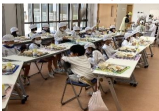
学校給食センター完成。食育やアレルギーへの対応も可能に 建設費総額 6.7億円、町負担 4.5億円