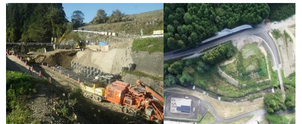
日曾利-南田切町道南田切線改良 総額 4.4 億円、町負担 1.2 億円