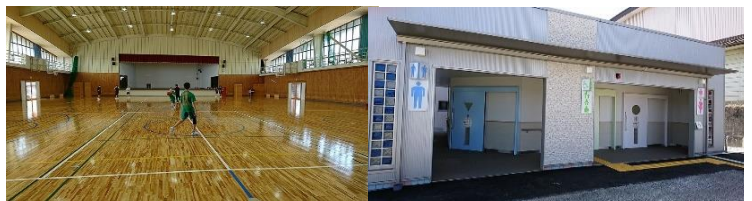
飯島体育館の床、更衣室、トイレ改修、北側屋外にトイレ新設 建設費総額 1.5億円、町負担 8300万円