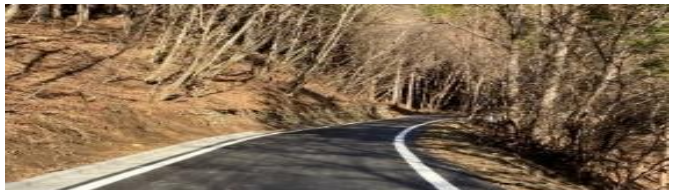
林道舗装「町民の森」や「傘山」登山のアクセスが快適に 3年総額 9600 万円、町負担 5300 万円