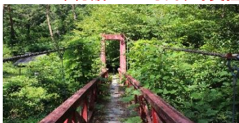
御座松橋改修 総額 2700 万円、町負担 2000 万円