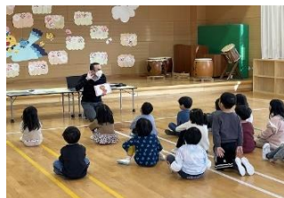
保育園で英語遊びトライアル