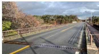
農道中田切橋修繕 総額 6000 万円、町負担 2000 万円