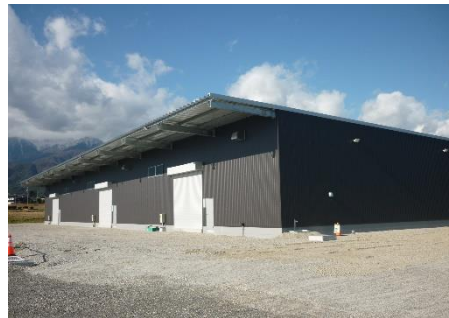
「信州西部陸送」様 石曾根へ