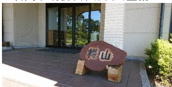
千人塚公園櫻山、テレワーク整備 総額 4800 万円、町負担 1700 万円