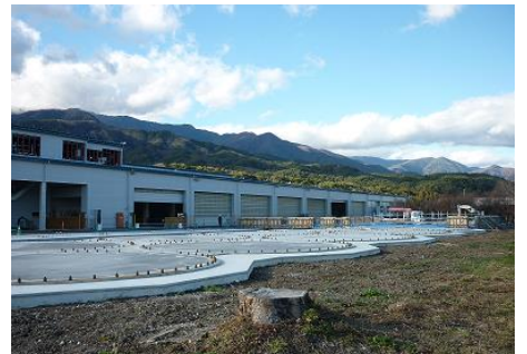
「JA 上伊那」様ライスセンター上ノ原へ