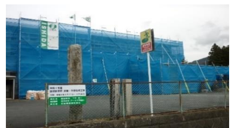
田切体育館改修 総額約 2700万円、町負担 800万円