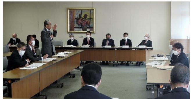
県庁で説明する「リニア北バイパス建設同盟」会長の下平町長