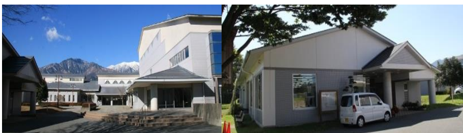
文化館改修や図書館の空調設備 総額約 2700万円、町負担 600万円