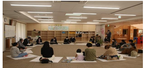
町長と子育てママとのおしゃべり会