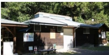
与田切公園トイレ、シャワー改修 総額 3500 万円、町負担 3000 万円