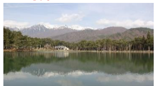
千人塚公園照明放送整備 町営総額 1700 万円