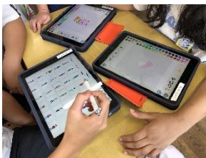
小中学校に iPad700台 電子黒板40台整備 総額 4200万円、町負担 2300万円