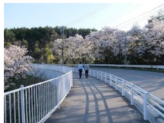
山久-柏木間農道歩道設置 県営約 10 億円、町負担 2 億円