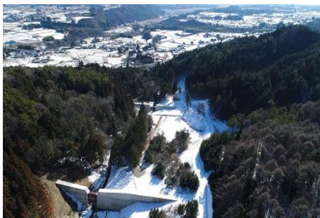
高遠原矢の沢川砂防堰堤完成で災害レッドゾーン解消 県営約 7.5 億円